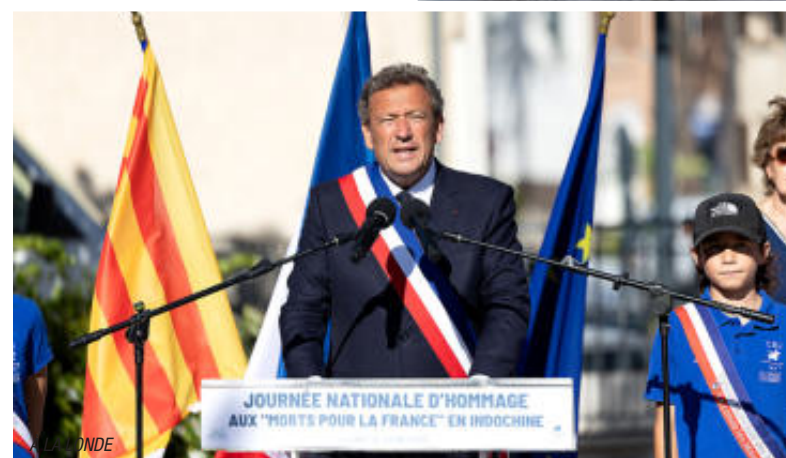
À LA LONDE