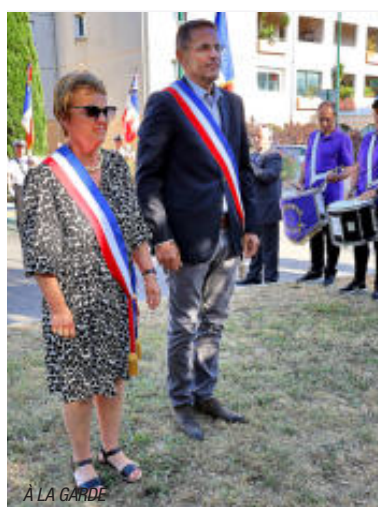
À LA GARDE