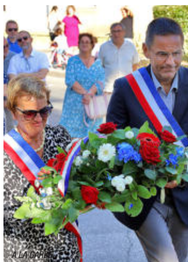
À LA GARDE