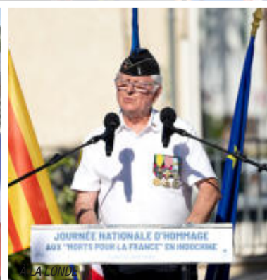
À LA LONDE