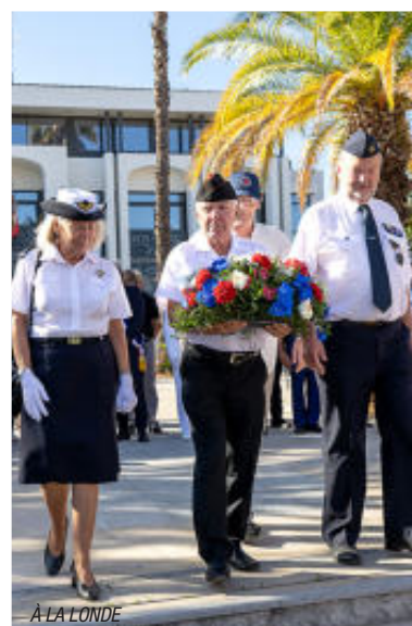
À LA LONDE